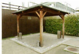
東屋風の屋外喫煙所。平成20年度に設置場所を検討したうえで予算化し、全面禁煙に合わせて完成させた。敷地内にはこの喫煙所を含め、屋外喫煙所が数カ所設置されている

ここでは全面禁煙へ移行した事業場の例をご紹介します。敷地内に事務棟や工場が点在するこの事業場では、平成21年10月1日付で建物の各フロアに設置されていた喫煙スペースを廃止、喫煙は屋外と建物屋上の喫煙所に限定する、全面禁煙に踏み切りました。それに先立ち、平成19年度以降、社用車の禁煙化、たばこ自販機の撤去などハード面の対策と並行して、禁煙教室の定期的な実施、産業医による禁煙相談、ニコチンパッチの無料配布など禁煙支援活動も積極的に展開、その結果平成19年度には26.8%だった喫煙率が、平成22年度には20.2%へと減少しました。喫煙者に対し受動／能動喫煙の害を周知し、意識改革・行動変容へと結び付けたことが、成功の秘訣といえそうです。