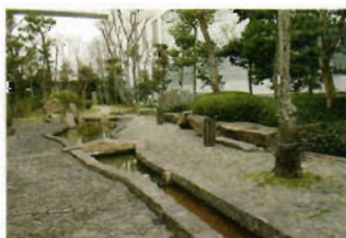
中庭に設けられた喫煙所。今後は非喫煙者の通行が多い喫煙所を廃止し、建物から離れた場所に集約することも検討中