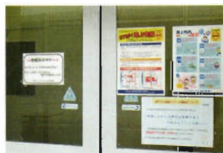
喫煙所には、喫煙マナーに関する注意書き、啓発のチラシで、路上喫煙の防止や非喫煙者への心配りを訴える