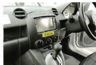
全面禁煙に先立ち禁煙化された社用車。「禁煙車」のステッカーが貼られる